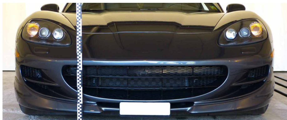
Expertise protection des occupants pour véhicules individuels