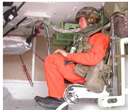
Véhicule de protection anti-mines

Essais de structures de protection contre les éboulements, essais généraux de matériaux ou simulation de dynamitage, chez nous, vous êtes au bon endroit.