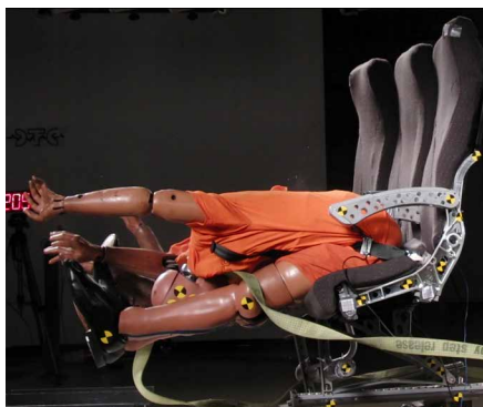
Essai aéronautique sur chariot

Sur nos installations, nous proposons tant des crashtests normés que destinés à la protection des consommateurs, ainsi que des reconstitutions d'accidents avec un ou deux véhicules. Ces tests peuvent être utilisés pour examiner des véhicules ou systèmes de retenue tels que glissières de sécurité, absorbeurs de choc ou barrières de circuits.