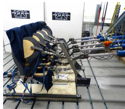
Essai quasistatique d'ancrage de ceinture

Une fois séparées du système global, nous testons des structures partielles à l'aide d'impacts, de projections, de tests de compression ou de traction de manière dynamique ou quasistatique au niveau du fonctionnement, de la force de résistance ou de la capacité d'absorption d'énergie.