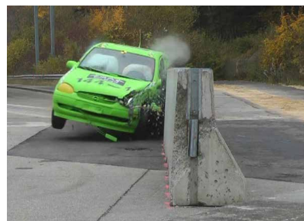
Systèmes de retenue pour véhicules

Pour les systèmes de retenue des véhicules, les systèmes de protection contre les éboulements et les engins de construction, nous effectuons des évaluations de conformité et des inspections (WPK) pour la certification et le marquage CE des produits en tant qu'organisme notifié (selon ISO/CEI 17065).