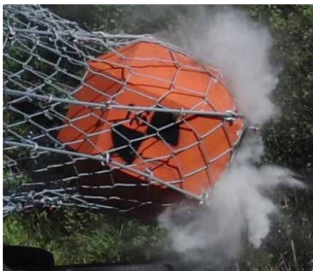
Barrières de protection contre les éboulements