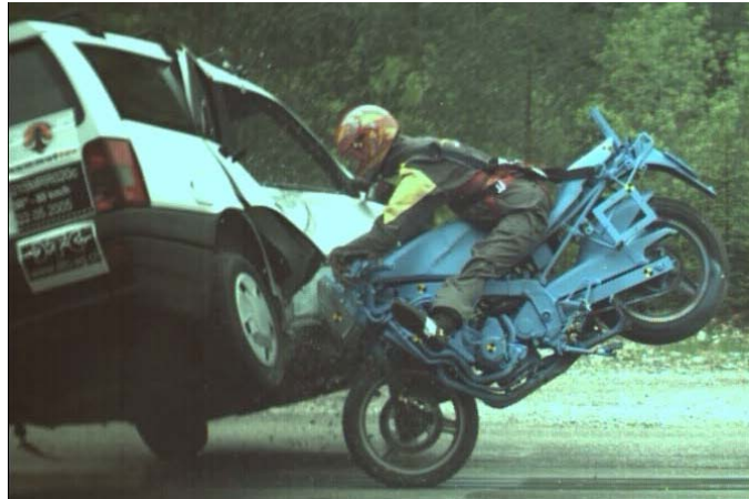
Sicherheitsgurt für Motorradfahrer