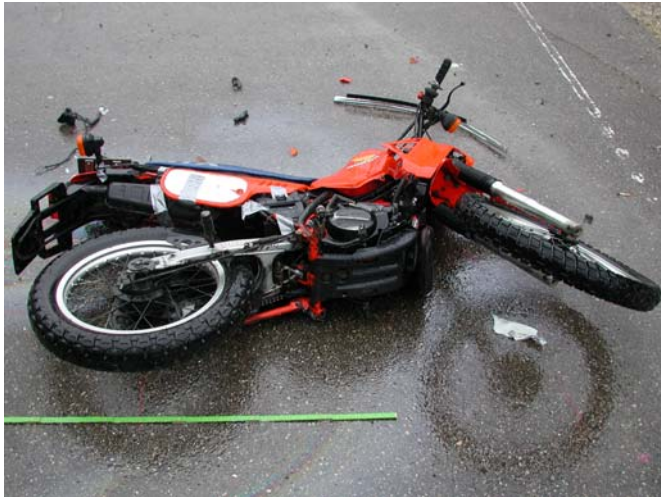
Honda MTX 125