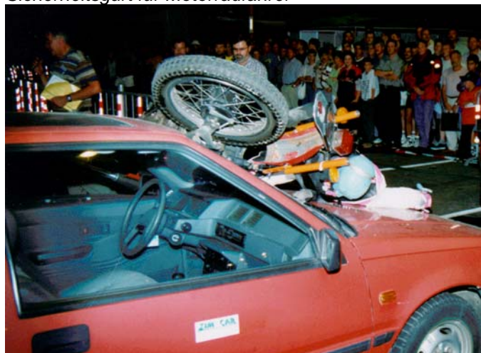
Sicherheitstag der Polizei