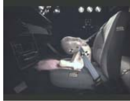
[07_ Seat Ibiza camera moved t = 80 ms]