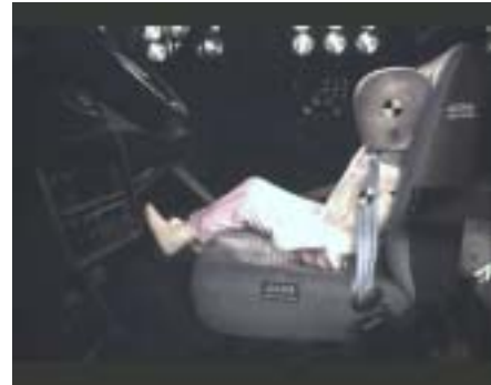
[09_ Seat Ibiza camera moved t = 160 ms]