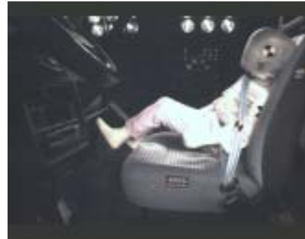
[10_ Seat Ibiza camera moved t = 200 ms]