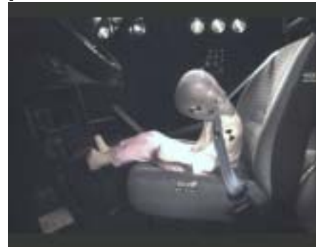
[08_ Seat Ibiza camera moved t = 120 ms]